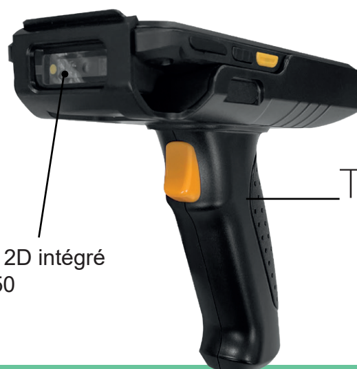
Scanner 2D intégré sur TA650